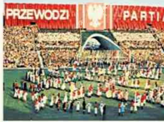
rys. Leszek Biernacki