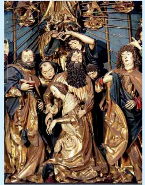
Wit Stwosz - „Dormition de la Mère de Dieu” (Cracovie - Kościół Mariacki)

Cette fête est célébrée en Pologne avec beaucoup de faste. Ainsi, des dizaines de milliers de pèlerins partent de tous les coins du pays, pour se rendre à pied à Częstochowa et être au rendez-vous le 15 août. De même, les pèlerins se pressent aussi par dizaines de milliers au sanctuaire marial de Kalwaria Zebrzydowska où les célébrations durent plusieurs jours, avec notamment des processions mettant en scène la Dormition et l'As-