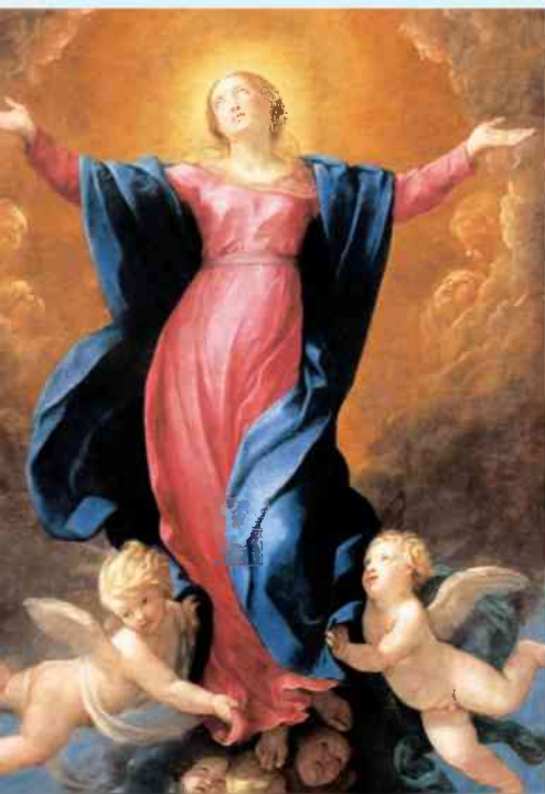
G. Reni - Wniebowzięcie NMP

Świątynia Boga w niebie się otworzyła i Arka Jego Przymierza ukazała się w Jego świątyni. Potem ukazał się wielki znak na niebie: Niewiasta obleczone w słońce i księżyc pod jej stopami, a na jej głowie wieniec z gwiazd dwunastu. Ukazał się też inny znak na niebie: Oto wielki Smok ognisty, ma siedem głów i dziesięć rogów, a na głowach siedem diademów. Ogon jego zmiata trzecią część gwiazd z nieba i rzucił je na ziemię. Smok stanął przed mającą urodzić Niewiastą, ażeby skoro tylko porodzi, pożreć jej Dziecko. I porodziła Syna – mężczyznę, który będzie past wszystkie narody różgą żelazną. Dziecko jej zostało porwane do Boga i do Jego tronu. Niewiasta zaś zbiegła na pustynię, gdzie ma miejsce przygotowane przez Boga. I usłyszałem donośny głos mówiący w niebie: „Teraz nastąpi zbawienie, potęga i królowanie Boga naszego i władza Jego Pomażaćca”.