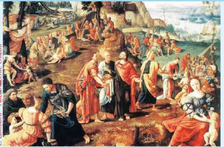
L. Lombard - Rozmnożenie chleba

Gdy Jezus usłyszał o śmierci Jana Chrzyciela, oddalił się stam-