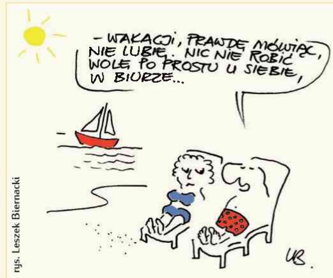
rys. Leszek Biernacki