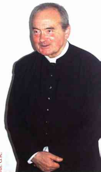
fol. G. K.

W wypowiedziach prelegentów zostało wyraźnie podkreślone,