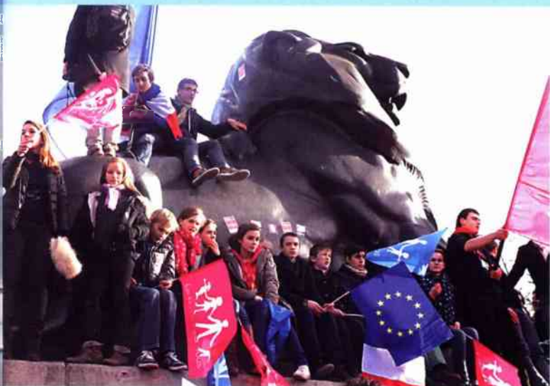
Paryż, 2 lutego 2014