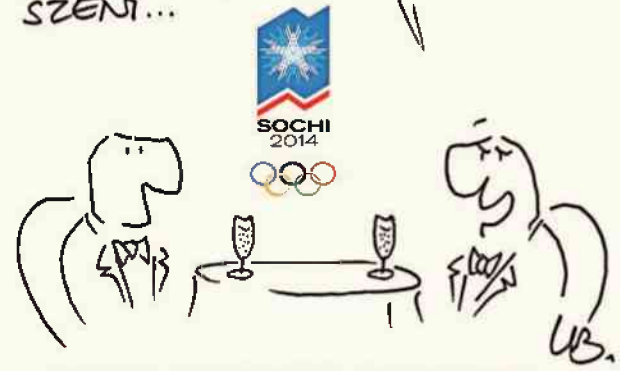
rys. Leszek Biernacki