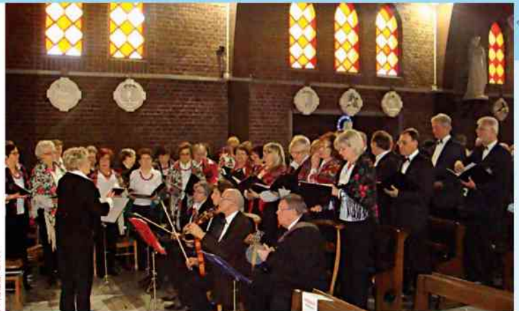
Chór Tradycja i Przyszłość Harnes