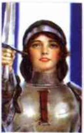
Ste Jeanne d'Arc