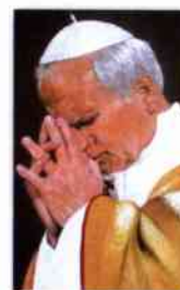
Bł. Jan Paweł II