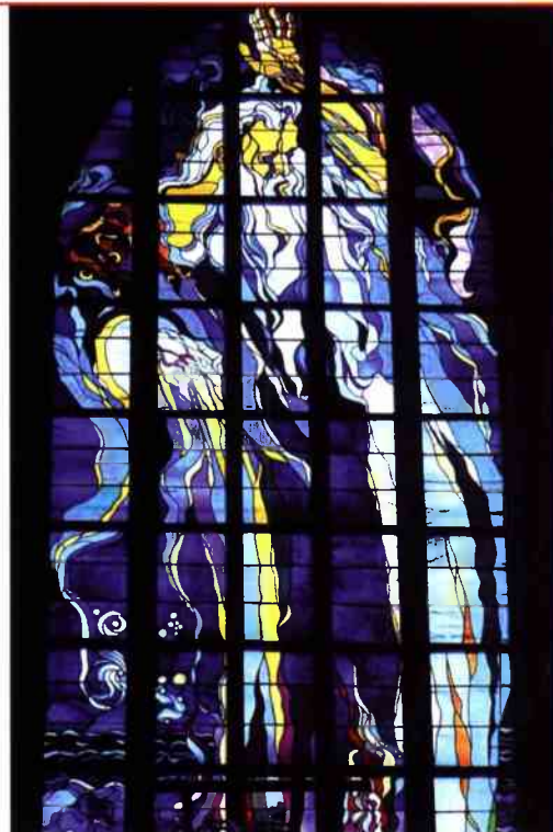
Stanisław Wyspiański „Bóg Ojciec”