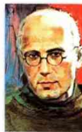
Św. Maksymilian Kolbe