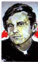
Bł. Jerzy Popiełuszko