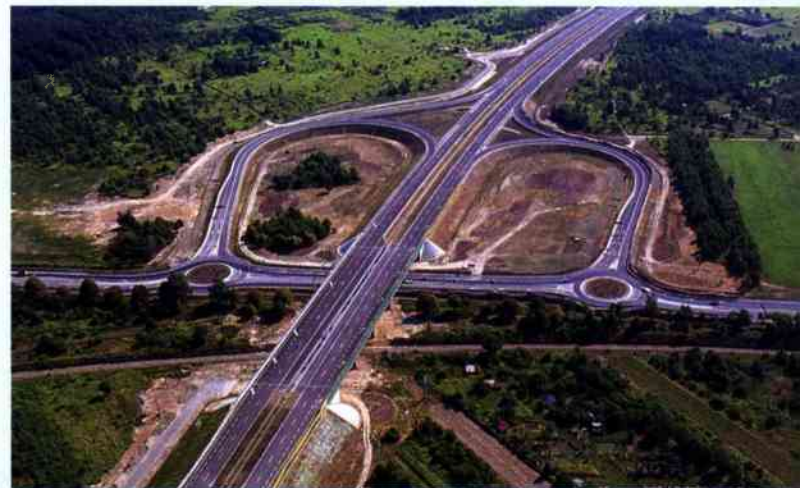
Autoroute A4 (Rzeszów Północ – Rzeszów Wschód)