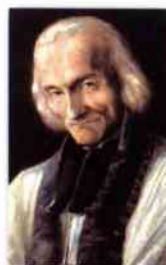
St Jean-Marie Vianney