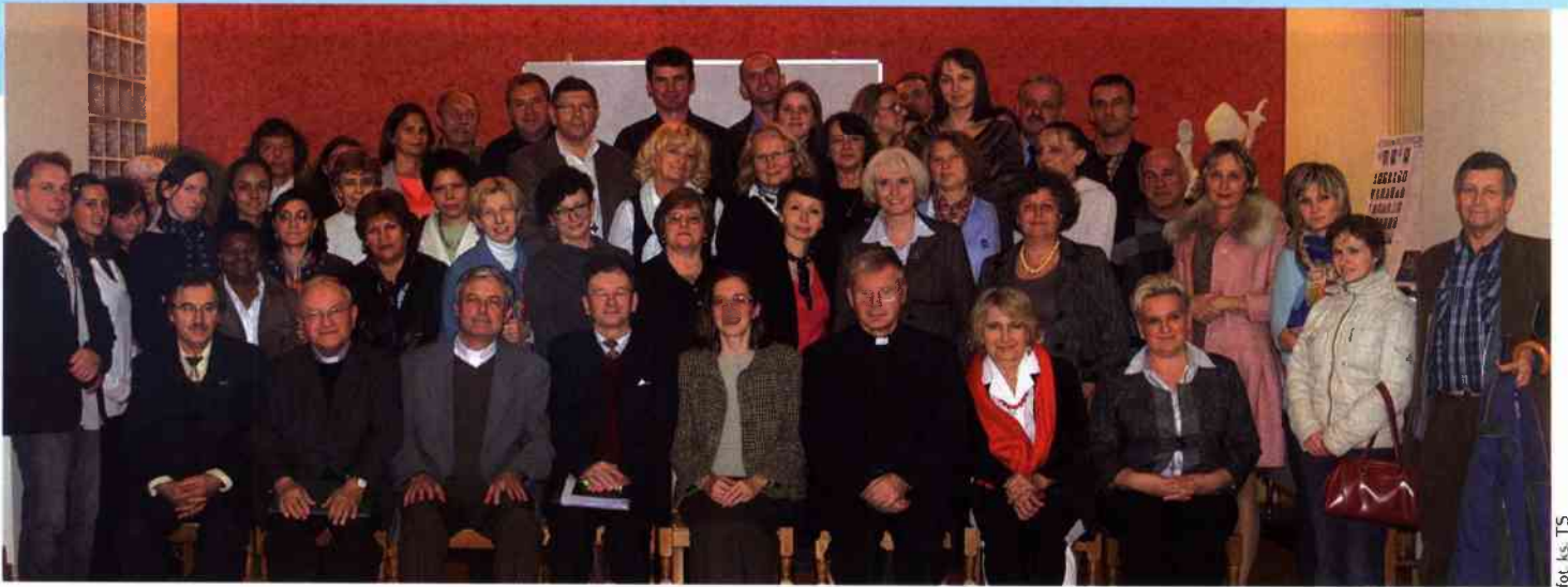
for. ks. TS