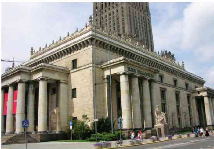
Teatr Dramatyczny w Warszawie

– W ostatnim roku czy dwóch arogancja władz samorządowych