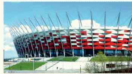
rys. Leszek Biernacki