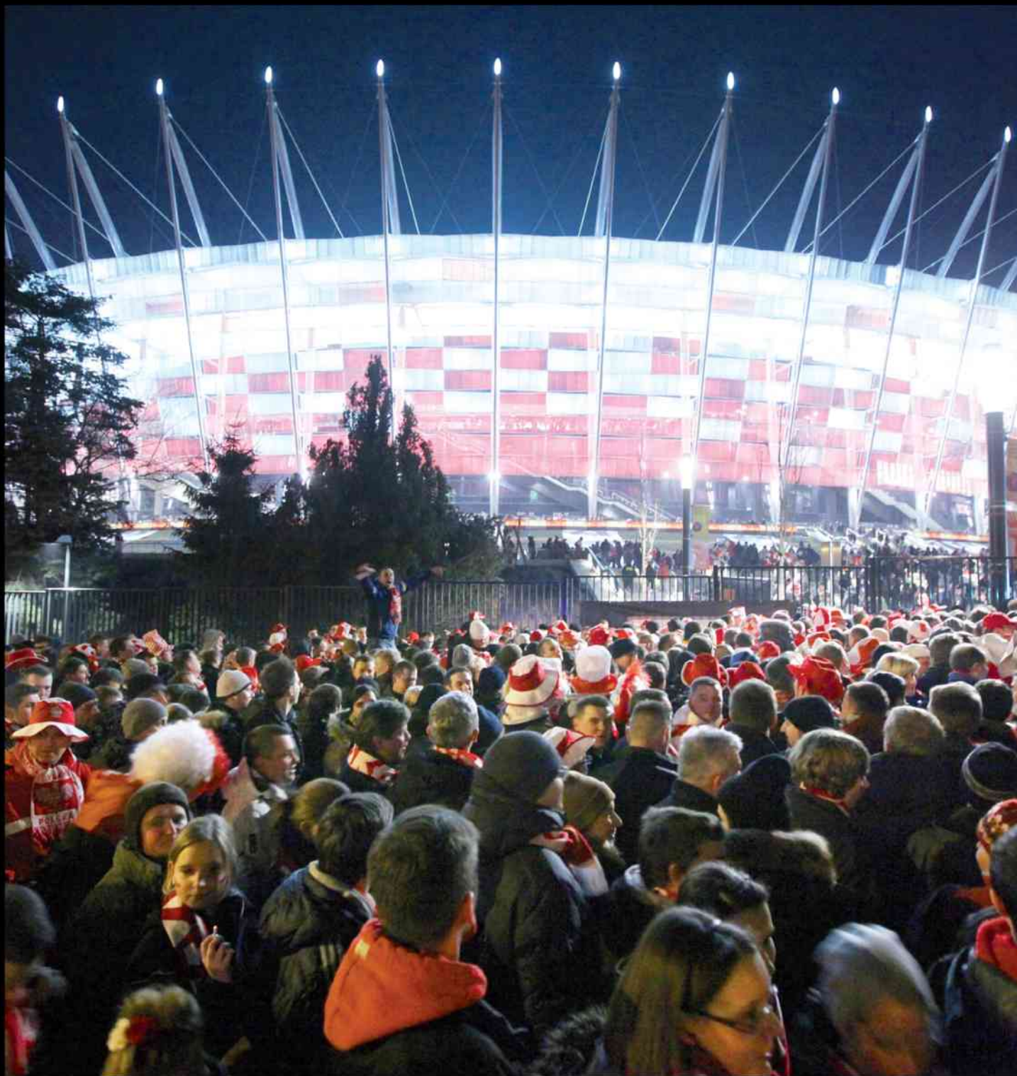
Warszawa - Stadion Narodowy