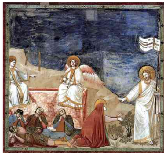
Cimabue – Zmartwychwstanie

Nie bójcie się, drogie Siostry i Bracia, bo Jezus Zmartwychwstał! Od tej chwili