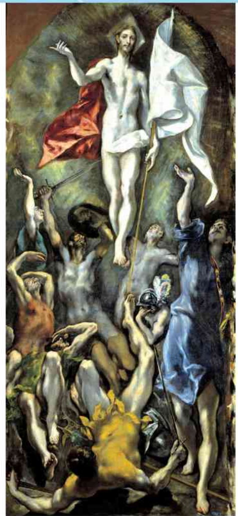
El Greco – Zmartwychwstanie

„Chcemy ujrzeć Jezusa” (J 12, 21). To była prośba pielgrzymów sprzed dwóch tysięcy