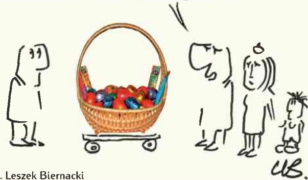
rys. Leszek Biernacki