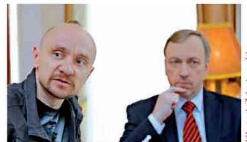
Klata i Zdrojewski

dzania Narodu Polskiego płynie od dawna z dwóch głównych centrów: z Czerskiej i z Wiertniczej. Na 50. rocznicę Powstania Warszawskiego przeczytaliśmy w „Gazecie Wyborczej”, że akowcy mordowali Żydów w Powstaniu. Od tego czasu te prowokacje nasilają się. Dość przypomnieć choćby obchody Święta Niepodległości. Ten dyktat jest wspierany przez obecną władzę polityczną; niewykluczone, że zgodnie z jakimiś niejasnymi „wytycznymi”, niekoniecznie z polskich centrów, niszczone jest trzon polskiej kultury narodowej, o którą tak bardzo zabiegał Jan Paweł II. □