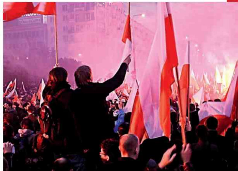
Marsz Niepodległości – 11 listopada 2012