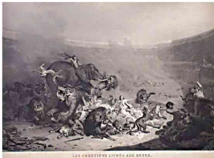
LES CHRÉTIENS LIVRES AUX BÊTES.

Najcięższe prześladowania przyszedł pod koniec długich rządów cesarza Dioklecjana, który zreformował cesarstwo i podzielił je na części wschodnią i zachodnią. Starając się rozwiązać problem sukcesji, Dioklecjan stworzył skomplikowany system władzy kolektywnej, w której główną rolę pełniło jednocześnie dwóch cesarzy na Wschodzie i Zachodzie, wspieranych przez dwóch kolejnych władców, ale niższej rangi. Po reformach administracyjnych, Dioklecjan uznał, że przyszedł czas na wzmocnienie ideowe nowej struktury. W jego ocenie zagrożeniem byli chrześcijanie, obecni już we wszystkich warstwach społecznych, praktycznie we wszystkich