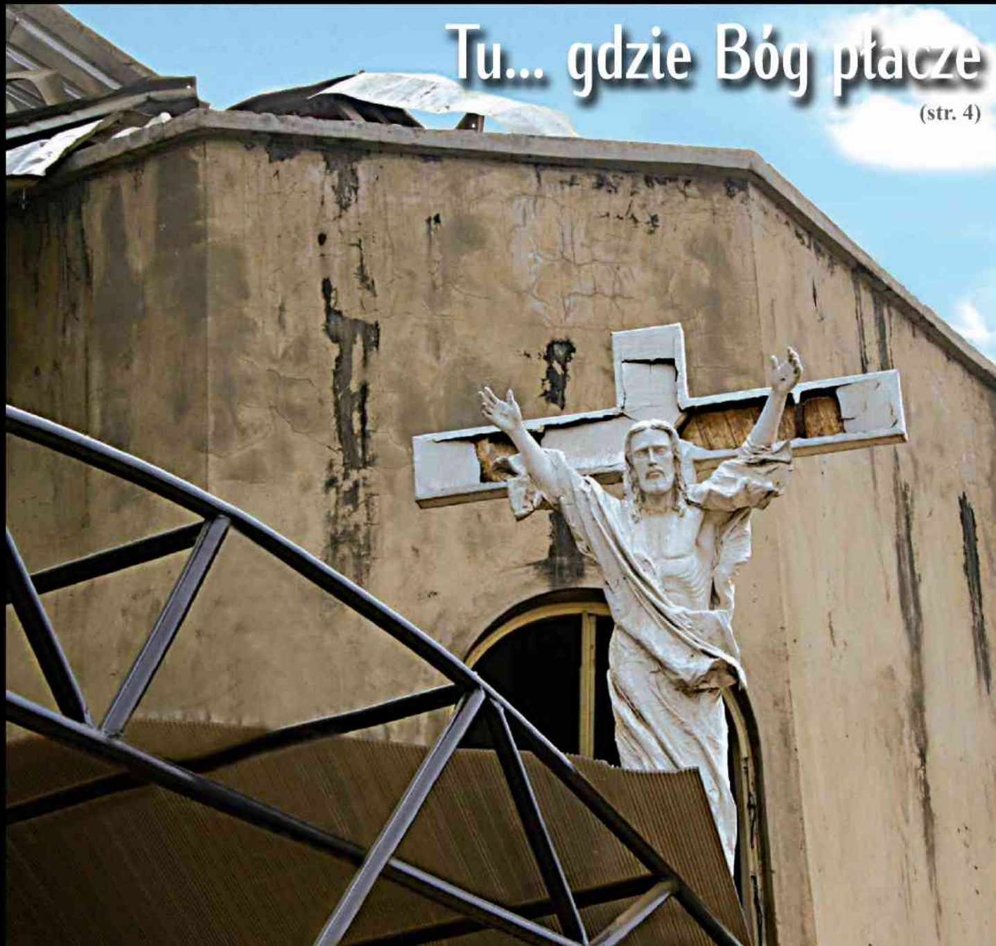
Nigeria - kraj prześladowań Chrześcijan