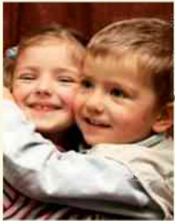
fil. M. J. Korycińska

Możemy śmiało powiedzieć, że sianie i zbieranie jest Bożą zasadą istnienia świata. Działa ona nie tylko w przyrodzie, w rolnictwie czy ogrodnictwie, ale również w moim i twoim życiu, Drogi Czytelniku. Stale się jemy i stale zbieramy owoce pracy naszych rąk – czy to zauważasz, czy też nie. To prawo Bóg włożył w serce człowieka, w nim realizujemy swoje powołanie. Rolą jest tutaj serce i wnętrze człowieka. Tam zasiewamy: zarówno dobro, jak i zło. Po-