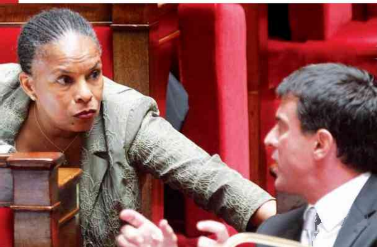
Valls – Taubira

Ambitny francuski minister spraw wewnętrznych Manuel Valls to najpopularniejszy polityk socjalistyczny, a jego działania w kwestii bezpieczeństwa nie odbiegają zbyt wiele od prewencyjnej polityki z czasów Sarkozy'ego.