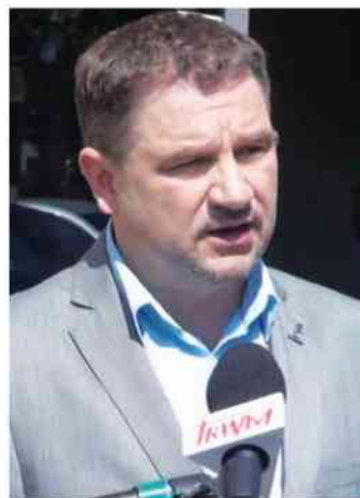
Piotr Duda - Przewodniczący Solidarności