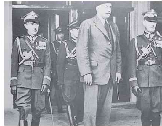
Polsko-brytyjskie rozmowy sztabowe – lipiec 1939

Brytania wypowiedziały Niemcom wojnę, to prawda. Polacy wiwatowali przed ambasadą angielską w Warszawie. To były radosne chwile. Pierwsze i ostatnie. Złudzenia zawsze mają potężną siłę. Tym większy po nich upadek. Następane dni i tygodnie jedynie potęgowały rozczarowanie. Mimo apeli i próśb polskich ambasadorów w Paryżu i Londynie o wypełnienie zobowiązań sojuszniczych, ci nabrali wody w usta. Była to ze strony Francji i Wielkiej Brytanii klasyczna zdrada sojusznika na polu bitwy. Postawa sojuszników przekreśliła przygotowany plan obrony Polski (tzw. plan obronny „Z”). W założeniu ofensywy sojuszniczej w piętnastym dniu wojny miała rozpocząć się francuska mobilizacja. Szef francuskiej misji wojskowej w Polsce, gen. Louis Fauray przybył do Polski pod koniec sierpnia 1939 r. Za czas jakiś uchylił rąbka tajemnicy, opisując rozmowę, jaką odbył 22 sierpnia 1939 r. ze swoimi przełożonymi – generałami Maurice'em Gamelinem i Alphonse'em Josephem Georges'em: „Poruszam z panami generałami kwestię, która nie daje mi spokoju – jeśli Polska stanie się przedmiotem agresji, to jedynie ofensywa wojsk francuskich będzie w stanie zmusić Niemców do zelżenia ich duszącego uścisku. W jakim terminie rozpocznie się ta ofensywa? Zapadło