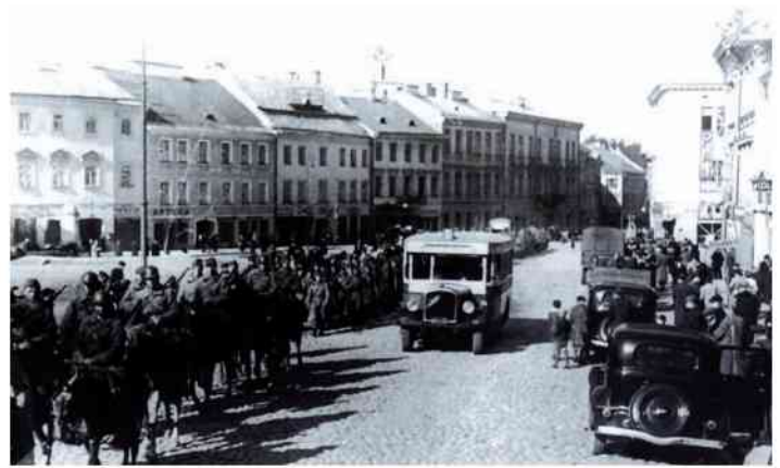
Armia Czerwona w Wilnie - wrzesień 1939

Anglia najpierw Mackiewicza zachwycała, teraz Anglicy zaczęli go przerażać. Powtarzał za Napoleonem, że Anglicy to naród składający się z „mężczyzn bez honoru”. W znakomitej książce o Anglikach pt. „Londyniszczanie”, Cat-Mackiewicz dowodzi, że „honor w naszym pojęciu w Anglii nie istnieje. Honor oznacza tam udzielane przez króla szlachectwo