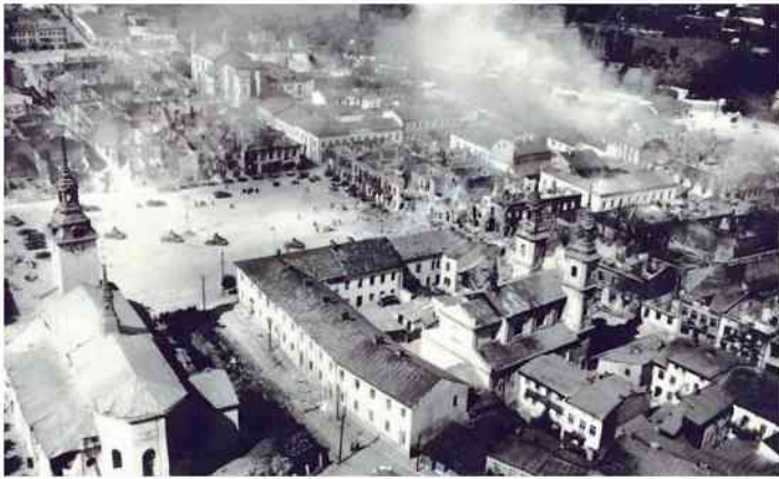
Czołgi niemieckie na rynku w Wieluniu - wrzesień 1939

Rzesza znalazłaby się w klinczu z zachodu (Francja), wschodu (Polska) i północy (Wielka Brytania).