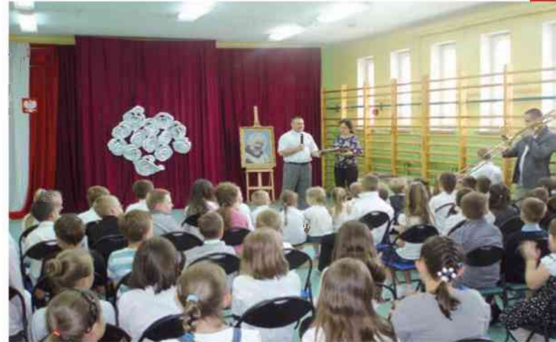
Katolicka Szkoła Podstawowa i Gimnazjum w Zamościu

Szczególnie ważną rolę w katechezie szkolnej pełnią katecheci. Często to od ich pracy, zaangażowania i charyzmy zależy kształt nauczania religii w przedszkolach i szkołach. Jeden z młodych księży swoją pracę z młodzieżą na katechezie szkolnej pojmuję w następujący sposób: „Uwielbiam lekcje religii. Współczesna młodzież jest świetna, otwarta, szczerą. Szuka, jak wszyscy wokół, miłości, akceptacji. Młody człowiek bardzo chce kochać i być kochany. Nigdy nie spotkałem się z agresją. Uczniów