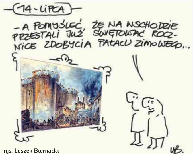
rys. Leszek Biernacki

więc d. filada - w mijającym historycznym fotu, pokrząjące przemówienia do republikańskiego ludu, no i w ogóle oświeceni, trójkolorowo i... mirażem na niebie. Alifci, na marginesie tej sielanki trzeba poczynić małą r. flek. je, nawet jeżeli to dziś nie uchodzi. Zwłaszcza, że osacza nas zewsząd i coraz ciasniej - peryferyjny postęp cywilizacyjny, żelzy nie powiedzieć rewolucja - poleczno ołczy. jowa. Chociaż nie jestem pewien czy obywatelom ostatnio, przez rządzących nad biedną Sekwaną, ułatwienia w eutanazji można zaliczyć jeszcze do fer i ołczy. jowości. Wkażymy razie jest się czego bać, im człowiek d. jrzałszy w latach. No ale wróćmy do t. j... biedy coraz bardziej piszczącej, chociaż wciąż nazywanej et. femistycznie kryzysem tylko. No więc - zważymy, wokół - im więc. j. nędzy, ubóstwa i de. per. a. ji, tym więc. j. serwu. je się nam. post. pu cywilizacyjnego". Przy czym, być może to nie jest jeszcze to najgorsze, w końcu nie taką dekadencją ludzkości już przeabiała przez ostatnie tysiąclecia, bardziej ją pokoi. mnie - na dzień dzisiejszy i tu, i teraz, że stoakawa jeszcze ostatnio Fran. ja. sta. je się jak i coraz. u. wyraźniej państwem... policyjnym! Tak, kre. jem, gdzie poli. ja. używana jest do z. prowadzania post. pu. dzi. jowego i porządku republikańskiego w wszelkimi sroakami... przymusu. P.O.