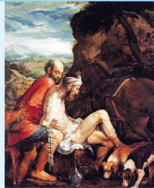
J. Bassano - Miłosierny Samarytanin

zapytał: „Nauczycielu, co mam czynić, aby osiągnąć życie wieczne?”. Jezus mu odpowiedział: „Co jest napisane w Prawie? Jak czytasz?”. On rzekł: „Będziesz miłował Pana Boga swego całym swoim sercem, całą swoją duszą, całą swoją mocą i całym swoim umysłem; a swego bliźniego jak siebie samego”. Jezus rzekł do niego: „Dobrześ odpowiedział. To czyń, a będziesz żył”. Lecz on, chcąc się usprawiedliwić, zapytał Jezusa: „A kto jest moim bliźnim?”. Jezus, nawiązując do tego, rzekł: „Pewien człowiek schodził z Jerozolimy do Jerycha i wpadł w ręce zbójców. Ci nie tylko go obdarli, lecz jeszcze rany mu zadali i zostawiając go na pół umartego, odeszli. Przypadkiem przechodził tą drogą pewien kapitan; zobaczył go i minął. Tak samo lewita, gdy przyszedł na to miejsce i zobaczył go, minął. Pewien zaś Samarytanin, będąc w podróży, przechodził również obok niego. Gdy go zobaczył, wzruszył się głęboko: podszedł do niego i opatrzył mu rany, zalewając je oliwą i winem; potem wsadził go na swoje bydlę, zawiózł do gospody i pielęgnował go. Następnego zaś dnia wyjął dwa denary, dał gospodarzowi i rzekł: »Miej o nim staranie, a jeśli co więcej wydasz, ja oddam tobie, gdy będę wracał«. Któryż z tych trzech okazał się, według twego zdania, bliźnim tego, który wpadł w ręce zbójców?”. On odpowiedział: „Ten, który mu okazał miłosierdzie”. Jezus mu rzekł: „Idź, i ty czyjś podobnie”. □