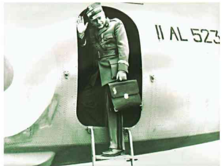
Generał Sikorski ostatni raz wsiada do samolotu

Kariera wojskowa gen. Sikorskiego zesła wyraźnie na polityczne tory po zabójstwie prezydenta Narutowicza w 1922 r., gdy został premierem rządu. Na okres jego rządu przypadło uznanie polskich granic wschodnich przez mocarstwa zachodnie; powołał Stanisława Grabskiego na ministra skarbu, zapoczątkowując reformę walutową i administracji państwowej. ciąg dalszy na str. 8