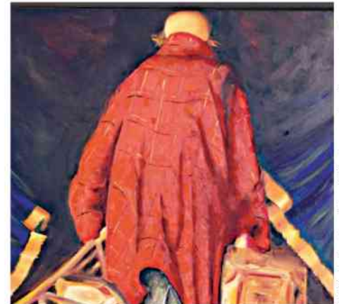
V. Voinchet. - Et voilà, le spectacle se termine

Ciekawe są też komentarze internautów, którzy wyśmiewają ideę salonu dla par homo i jego spektakularną porażkę. Jeden z nich, dość słusznie napisał: 1000 małżeństw „dla wszystkich” w 2013, 100 w 2014 i... 4 w 2015. I tak się zapewne to skończy naprawdę, ale popsuta instytucja małżeństwa pozostanie, a właśnie o to, a nie o żadne „prawa homosiów” w tym całym cyrku chodziło. □