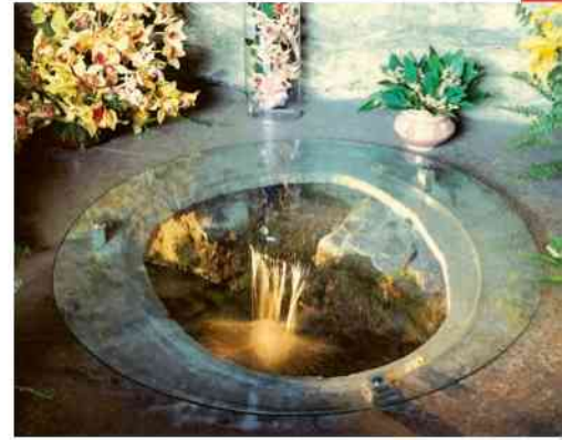
Cudowna woda w Grocie Massabielskiej

Dokładnie, 11 lutego, w święto Matki Bożej z Lourdes i Świątorki Dzień Chorego, w czasie uroczystego konsystorza, Benedykt XVI oficjalnie ogłosił swą abdykację ze względu na wiek i pogorszenie się od kilku miesięcy stanu jego zdrowia.