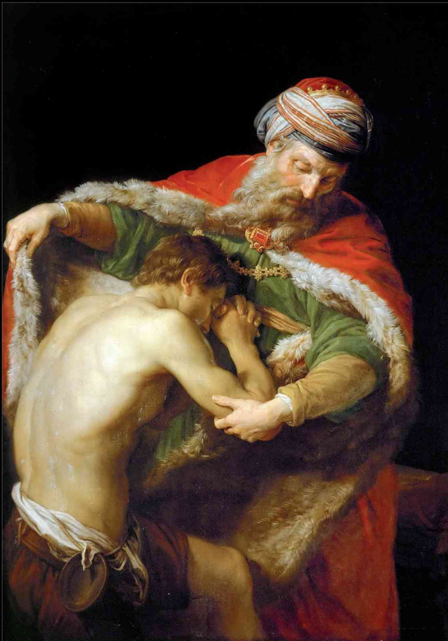
Pompeo Batoni – Powrót syna marnotrawnego