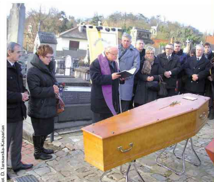
fol. D. Tarnawska-Kasparian