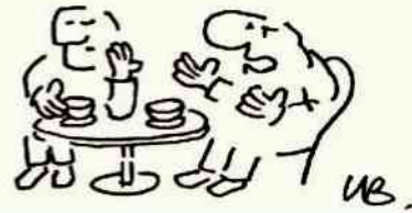
rys. Leszek Biernacki