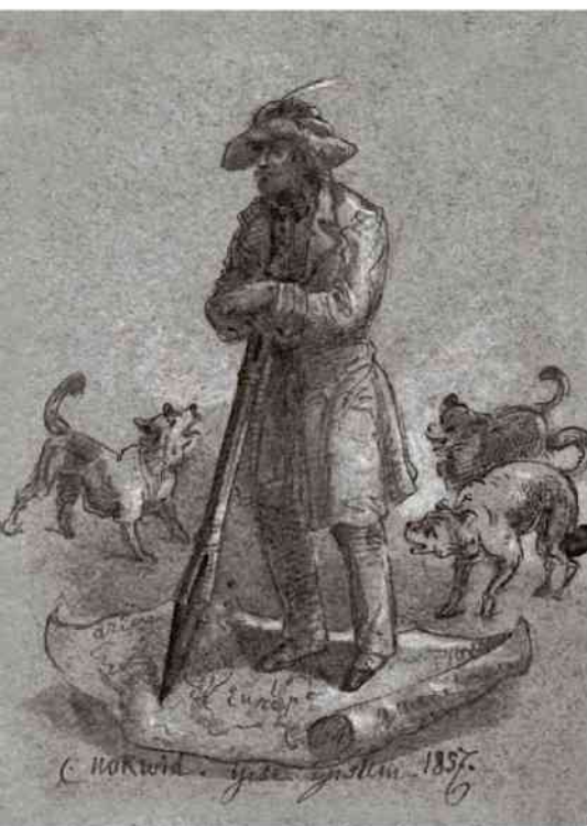
C.K. Norwid - Autoportret