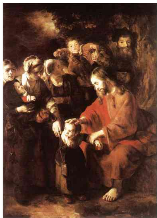
N. Maes – Jezus błogosławi dzieci

I dlatego gwaro w polskim kościele w Anglii. Miałem dwa dni takiego gwaru u siebie. Pojeżdżali się na Wielkanoc młodzi z różnych stron Polski i świata. A z młodymi – ich dzieci. Pogoda dopisała, jedne dzieci z mamą i tatą przysły, inne przyjechały samochodami. Kiedyś to nadmiar tego gwaru mnie rozpraszał. Ale przecież kazanie mam napisane – myśl nie ucieknie. Pod ornatem ukryty regulator wzmocnienia, mocy w głośni-