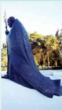
Pomnik Jana Pawła II w Fatimie

Przypadała ona w rocznicę pierwszych objawień maryjnych sprzed 94 lat. W portugalskim mieście zgromadziło się 13 maja b.r. ponad ćwierć miliona pielgrzymów. Za wskazaniem episkopatu Portugalii dziękowali oni Bogu za wyniesienie Jana Pawła II do chwały ołtarzy. Jego postać i związki z Fatimą przypominał kard. Sean O'Malley OFM Cap z USA, który przewodniczył liturgii. Abp Bostonu wyraził głębokie przekonanie, że to MB Fatimska ocaliła swego wielkiego czciciela z zamachu na placu św. Piotra. Podkreślił znaczenie polskiego Papieża dla obalenia „żelaznej kurtyny” i komunistycznej opresji. Wielu modliło się też przy jego pomniku. Po Mszy św. fatimscy pielgrzymi byli świadkami niecodziennego zjawiska różnobarwnej obręczy wokół słońca. Niektórzy uznali to za cudowny znak, przypominający „taniec słońca”, który towarzyszył ostatnim objawieniom maryjnym w październiku 1917 r.