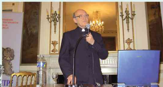
Dom SPK, konferencja ks. prof. M. Hellera (2009 r.)