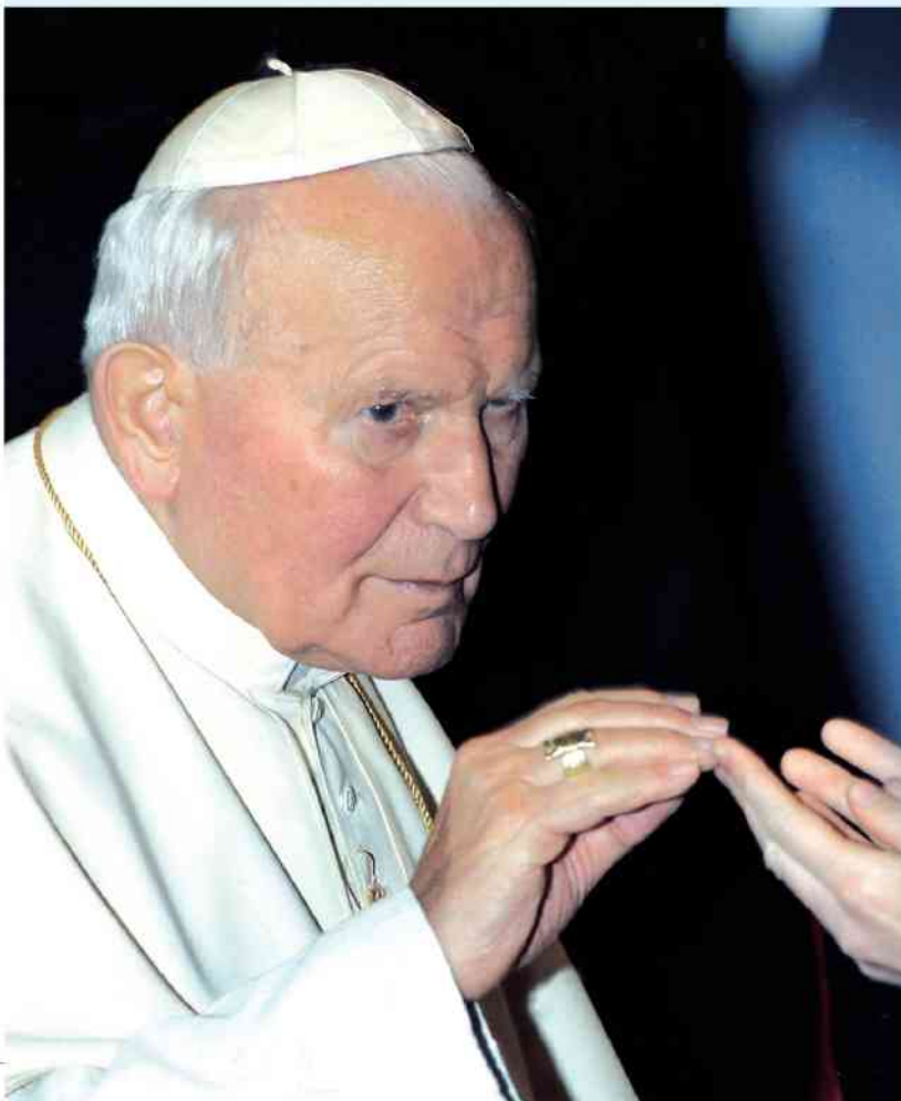
fol. P. Fedorowicz