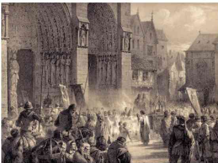
Św. Ludwik wnoszący Koronę Cierniową do Katedry Notre-Dame w Paryżu 19 sierpnia 1239 r. Rycina z XIX w.

Cierniowa korona, przypominająca o cierpieniu Jezusa już od szesnastego wieku, czyli od chwili jej znalezienia, czczona jest z wielkim nabożeństwem przez ogromne rzesze chrześcijan. Pierwsze wzmianki dotyczące korony posiadamy z przekazów pielgrzymów udających się do Jerozolimy w IV wieku. W 409 r. znajdowała się ona w bazylice na Górze Syjon w Jerozolimie. Na ziemi jerozolimskiej korona ta była jeszcze do 870 r. Między