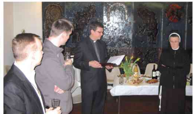
fol. s. J. Korycińska