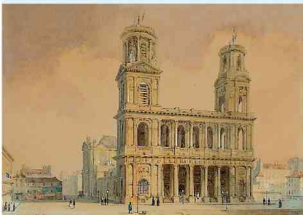
F.E. Villeret „Eglise St Sulpice” (début XIXe)