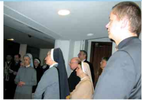
fol. s. J. Korycińska