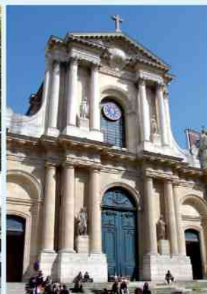
Eglise St Roch