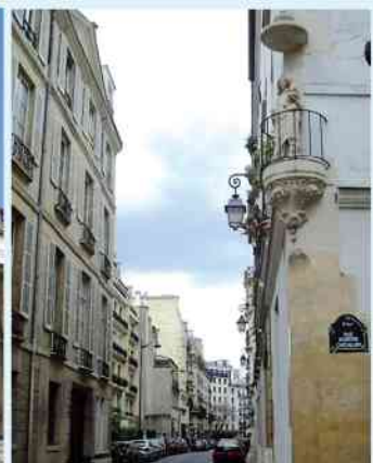
Rue Cassette - Rue Honoré-Chevalier