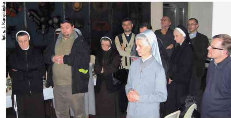
fol. s. J. Korycińska