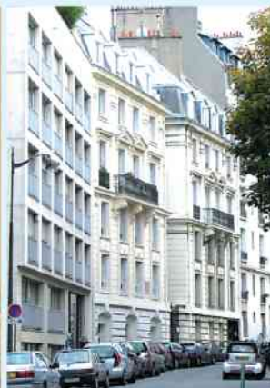
rue Notre Dame des Champs