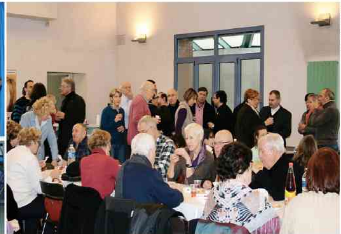
fol. A. Pastuszek