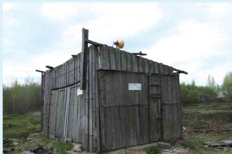
Aéroport de Smolensk

pays suivant. Et même sur le plan intérieur, il conviendrait de renoncer et de remettre son mandat au lieu de se dire que tout va bien parce que le soleil a brillé aujourd'hui.