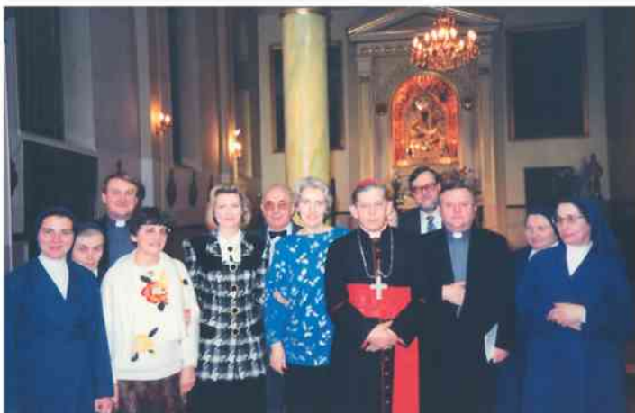
W kaplicy Zakładu św. Kazimierza