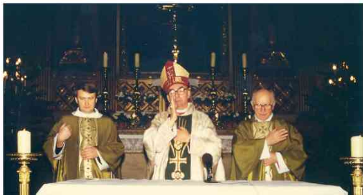
19 stycznia 1986 r. Polska Misja Katolicka we Francji (początek sprawowania urzędu) rozpoczęła Nowy Rok w nowej aurze.