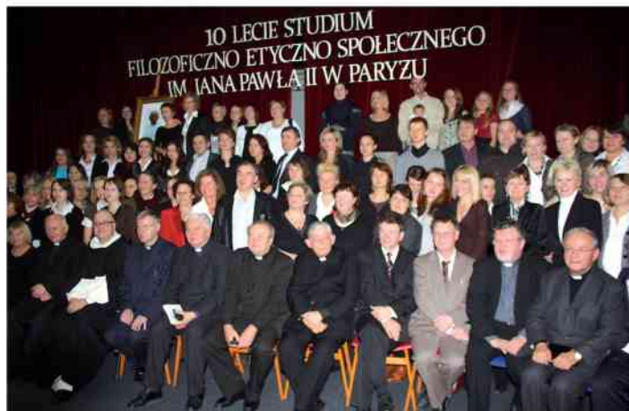
10-lecie paryskiego Studium filozoficzno-etyczno-społecznego