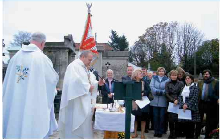
Na Cmentarzu polskim w Montmorency

Po raz pierwszy, i to stanowi ewenement, polonijna delegacja świeckich z Francji, jedzie i uczestniczy później przez kolejne lata w ogólnopolskich sesjach II Synodu Plenarnego. Pełna jest również współpraca Ks. Rektora i PMK z różnymi organizacjami świeckimi we Francji poprzez m.in. coroczne pielgrzymki do Montmorency, Msze św. przy pomniku ku czci Tadeusza Kościuszki w Montigny sur Loing, czy też uczestnictwo