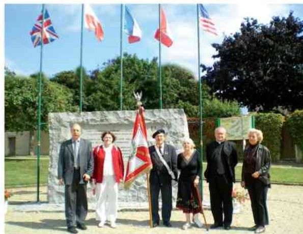
Uroczystości kombatanckie w Normandii