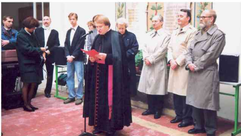
Zakończenie roku szkolnego w Szkole Polskiej w Paryżu