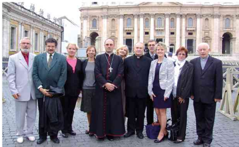
Polska Rada Duszpasterska Europy Zachodniej – Delegacja z Francji (Rzym 2010)