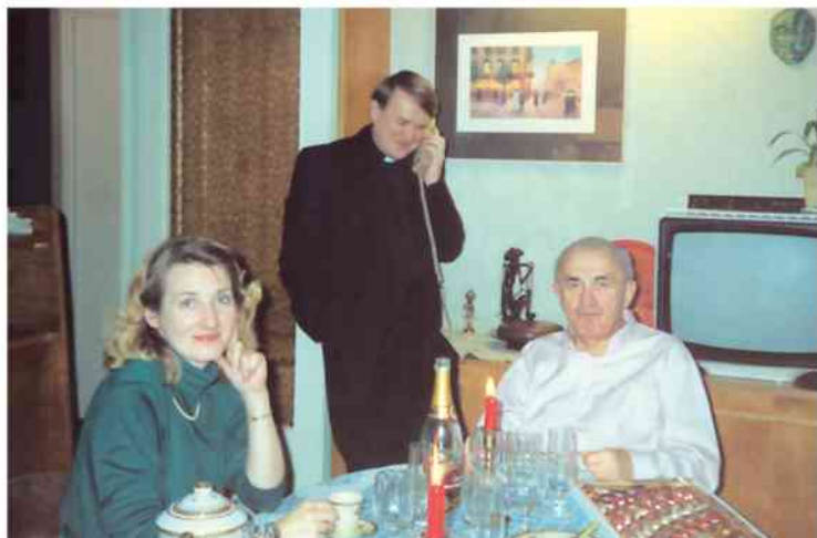
Bywał u nas w domach, by nas „poczuć” i poznać.