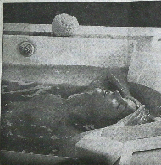
▲ W hydroterapii stosuje się hłita, rodzaj żupanu wapienia, m.in. do masażu podwodnego, masażu urowągu rąk i nóg, kąpeli kwasowęglowych, a także do okładów borowinowo-parafinowych.

Kiedy jesteś w złym nastroju połóż w gorącej wodzie z dodatkiem melisy. (P)