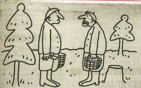
- Na razie rosną tylko ceny.