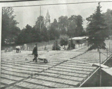
▲ W czesko-cieszyńskich areale tenisowym nad Ołżą wystrawa nowy obiekt sportowy, który pomieści zaizolowane sanitarno-higieniczne, szatnie oraz świetlicę dla tenisistów z Klubu Sportowego „Sławy” Cz. Cieszynej. Pomimo iż budowa idzie sprawnie i szybko, szacowana zostanie prawdopodobnie dopiero w roku przyszłym.

Zdaniem Bohumira Bobáka, burmistrza Orłowej, ludzie często nie rozróżniają kompetencji. „Wiele osób przychodzi np. w sprawie przedłużenia zasiłku dla bezrobotnych, przydziału mieszkania czy działki pod nowy dom. Od załatwienia tego typu spraw są poszczególne wydziały UM. Ich pracownicy znają się na rzeczy. Oni też najlepiej zorientowani są w poszczególnych zagadnieniach”.