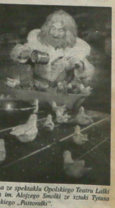
▲ Scena ze spektaklu Opolskiego Teatru Lalki i Aktora im. Alojzego Smółki ze sztuki Tytusa Cztywskiego „Pastorki”.