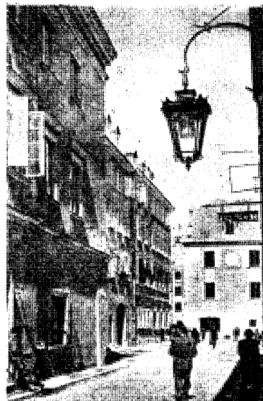
POLACY Z PIETYZMEM ODBUDOWALI STARĄ WARSZAWĘ Na zdjęciach: Narożnik Piwnej i Piekarskiej z ulicy Zapiecek