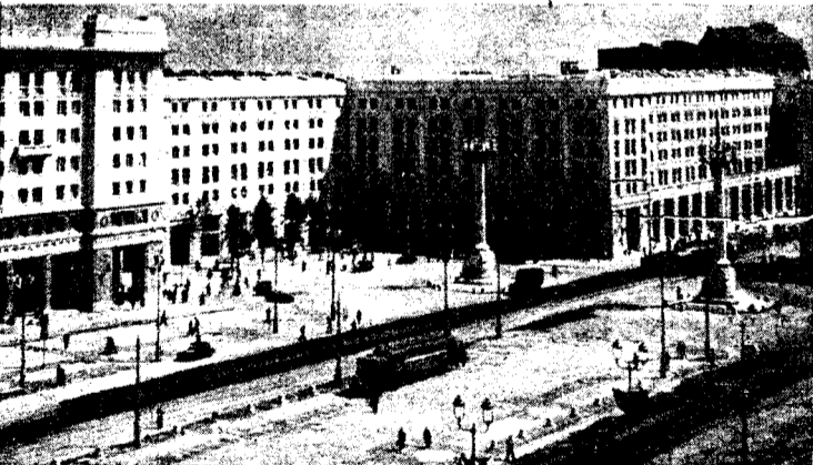
MIESZANINA CELOWOŚCI URBANISTYCZNEJ Z WPLYWAMI WSCHODU Od góry: Trasa „W-Z”; Zespół gmachów Coraziego z pomnikiem twórcy czerezwyczajki Feliksa Dzierżyńskiego! i t. zw. Plac Konstytucji czyli fragment ulicy Marszałkowskiej z pseudomonumentalnymi domami mieszkalnymi.

oni tak ulepszą metody uprawy, że ogólne zbiory okazują się wyższe.