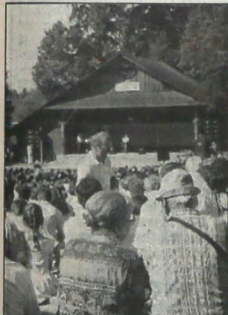
A. Gorolski Święto '97'. Czy następane będą również udane?