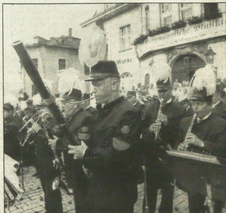
▲ Górnická orkiestra dęta „Májovák” z Karwiny z dużym powodzeniem koncertowała w niemieckim Schwarzenbergu. Wzięła tam udział w festiwalu kapel górniczych, który odbywał się w dniach od 6 do 14 września.

Ponieważ jednak również sieć kanalizacyjna w tej osiedle znajdowała się w stanie, lekko mówiąc, krytycznym, postanowiono oba przedsięwzięcia zrealizować za jednym zamachem. Niestety, nie od razu udało się zdobyć potrzebne środki i początek prac się opóźnił. Na szczęście wszystko udało się doprowadzić do szczęśliwego końca.