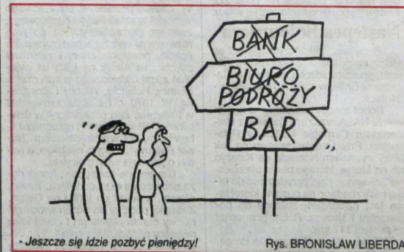
„ Jeszcze się idzie pozbyć pieniędzy!