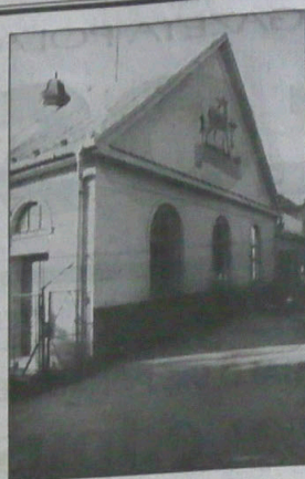
▲ Bywalcami restauracji „Pod Jeleniem” w Hawierzowie-Szumbarku są w większości mieszkańcy pobliskiego osiedla zbudowanego w latach 80. Starsi szumbarczanie pamiętają jeszcze odbywające się tu „u Paluchów” huczne polskie festyny - szkolne i pezetkaowskie, przedstawienia amatorskiego zespołu teatralnego, zaglądała tu Scena Polska...