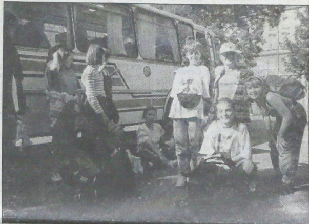
▲ Nie bardzo chcieli się wracać do domu, które spędzali wakacje na kolonjach letnich w Gorzowie Wielkopolskim i Elku. Niestety, turnus się zakończył i w niedzielę zjawili się w Czeskim Cieszynie.