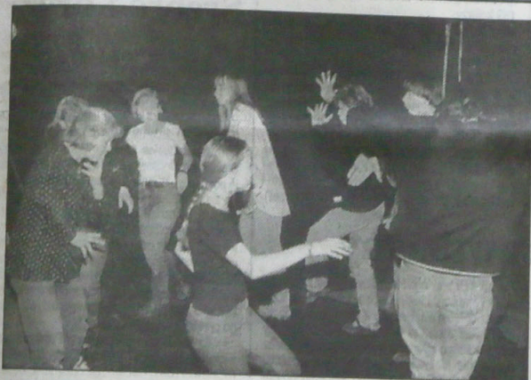
▲ Wczoraj zakończył się w Koszarzyskach tegoroczny Kurs Teatralny GAIMSZ-a. Zdobyte na nim wiadomości i doświadczenia kursanci wykorzystali m.in. do przygotowania sobotniego programu „Čarovná čajovna - kočovná a ušimutá spoločnosť imienia mjr. Szmauzma” wystawionego w sobotę w ramach dnia otwartych drzwi (na zdjęciu).

TEATR LALEK „BAJKA” przyjmie od zaraz dziewczynę i chłopaka do pracy aktorskiej. Kontakt pod nr tel. Cz. Cieszyn 71 28 59.