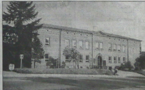
▲ Gmach trzyŃnieckiej jubilatki.

PRAGA - Według najnowszej ankiety przeprowadzonej przez IVVM, a dotyczącej preferencji wyborczych, największą liczbą zwolenników dysponuje obecnie ČSSD. Na socjaldemokratów głosowałyby obecnie 28 proc. ankietowanych, o 3 proc. więcej niż w maju. O 2 proc. (do 20) wzrosło w porównaniu do maja poparcie dla ODS. KDU-ČSL popiera 11,5 proc. wyborców, o 3 proc. mniej niż w maju, ODA - 7 proc. (w poprzednim miesiącu - 10 proc.). Wzrosło poparcie dla KSCM oraz republikanów, partie te wybierałyby obecnie odpowiednio 8 i 4 proc. ankietowanych.