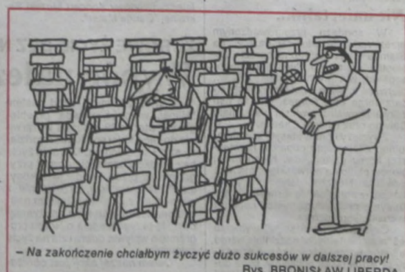
- Na zakończenie chciałbym życzyć dużo sukcesów w dalszej pracy! Rys. BRONISŁAW LIBERDA

Kolejna impreza w ramach "Maja nad Olzą" odbędzie się w niedzielę 11 bm. W Parku Zdrojowym przedstawi się zespół "Beskid" z Bielska. Wypada mieć nadzieję, że tym razem pogoda będzie już prawdziwie majowa.