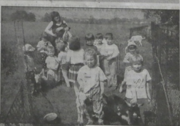
◆ Oldrzychowickie przedszkolaki.

Oldrzychowicka jubilatka jest przedszkolem zbiorczym. Dojeżdżają tu dzieci spod Koziańca, spod Jaworowego, z Tyry, z Tyrskiej, a bywało, że i z Trzyńca. Niestety, coraz mniej rodziców decyduje się narazić dzieci na trudy codziennych dojazdów. Zamknięcie placówki w Oldrzychowicach-Wsi spowodowało, że rocznie przy-