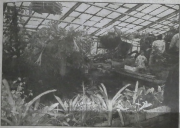
▲ „Flora '97” Ołomuniec: w barwnym i egzotycznym świecie tropikalnej roślinności.