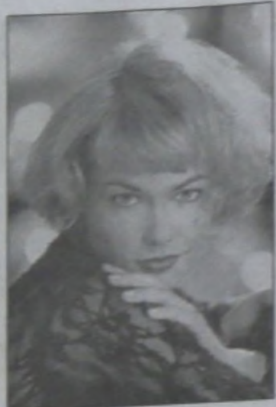
środku. Gdy chcesz ukryć nieregularną nasadę włosów, a czoło masz zbyt płaskie lub opadają na nie włosy z czubka głowy, dobrze jest zakryć czoło grzywką wystrzępioną albo prostą.

Przy ładnie zarysowanej nasadzie włosów, lecz zbyt wysokim i wypukłym czołem dobrze wyglądają grube loki lub fale optycznie zwięzające skronie, a także - w zależności od kształtu twarzy - przedziałki z boku albo po-