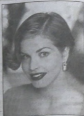
szczępłej twarzy przy gładkiej fryzurze można odnieść wrażenie, że uszy są zbyt duże, a nawet lekko odstają. Wystarczy wybrać fryzurę kończącą się na linii brody lub z kołyszącymi się przy uszach lokami. (MAG)

Najczęściej jest to tylko złudzenie optyczne. W przypadku bardzo