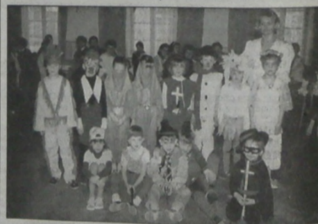
▲ Pierwszoklasiści na bałku PSP w Jabłonkowie. Fot. archiwum PSP

Zwierzienia dla Głosika Mity Głosiku! Dzisiaj opowiem Ci, jak to było na naszym bałku. Tak więc, kiedy przyszedł o pół godziny wcześniej do sal hotelu „Płast”, byli tu już bał wszyscy rodzice i czynili ostatnie przygotowania. Dokładnie o godz. 15.00 pojawił się Piotrusz Pan ze swoimi pomocnikami - Małym i Dużym, serdecznie witając wszystkich na statku kapitana Haka i zaprosił do wspólnej zabawy. Wtem zabrzmieli pierwsze taktki i cała nasza klasa razem z klasą piątą stanęła do uroczystego poloneza. Nasi młodzi koledzy przygotowali wspaniałe tańców ludowych - Piekiła placki, Przyśle chłopy z wojenki. Nie chęć cę... Do tańca przystępowali nam rodzice, Tarek, państwo Kozłowie. Na naszym bałku wystąpiła też para taneczna zespołu „Ełani” pokazała, jak wspaniale potrafią tańczyć dzieci. Nie zabrakło też tradycyjnych atrakcji bałkowych: był korowód masek z wyborem te! najciekawszej, było koło szczęścia, wędka, loteria, były różne zabawy i gry taneczne... Bawiliśmy się wspaniale i wcale nam się nie chciało wracać do domu. Bardzo dziękujemy naszym rodzicom za przygotowanie tak cudownej imprezy, dziękujemy też wszystkim sponsorom za pomoc, hotelowi „Płast” natomiast za wyprzedzenie sali. Szkoła tylko, że następny bałk będzie dopiero za rok. MARTA BRANNA klasa 4, PSP Cz. Cieszyń