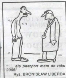
... ale pasport mam do roku 2005! Rys. BRONISŁAW LIBERDA