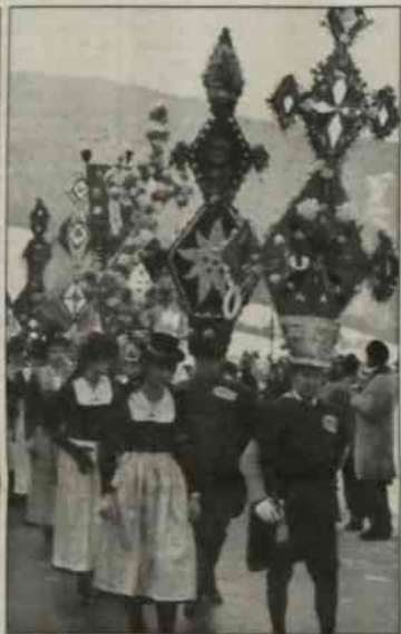
▲ Tradycyjne stroje ludowe zadziwiają swoją pomysłowością - „dzwonniczy” z Solnej Komory

I ndustrializacja, uwalniająca dzień powszedni, znacząco przemieniła stosunek Europejczyków do tradycji Świętą Bożego Narodzenia. Kiedy szedłszy po oświetlonych ulicach, patrzymy na rozgarzone wietrzyki sklepów z nieodłączną choinką, często przychodzi nam do głowy nie wysłowne pytanie - Czy aby to Święto nie zostaje przehandlowane, a jego tradycja zatraczona w nieskończoność - to tu, to tam - „wiglipek” i imprez z gatunku „Może przyjdzie i Mikolaj?” W czas adwentu zamiast wspólnego śpiewu pieśni religijnych słychać komentarze co i po ile, a czas dawniej trawiony na własnoręcznym przygotowaniu prezentów gwiazdkiżony sprowadza się dziś do galopu po sklepach. Święta Bożego Narodzenia były ongiś jedyną okazją do dostojnego napędzenia się, a dzieciom umożliwiała nadto bezgranicznie buszowanie w sklepach, w okresach pozawieloletnich towarzysząc wręcz reklamowaniu. Dzisiaj nie tylko tu urok doznany jakby spowieszczenia. To, co kiedyś uznawano za niebiański spokój - gdy puszasty śnieg okulił ziemię i ni psizka, ni pluska tak słychać nie było, bo wtem panowała najcisza pora roku - leż, jak się wydaje, nieodwołalnie usuwa się w przeszłość. Zimy w miastach są mniej śnieżne, a na wsi w buczenie transformatora wznosi się alarm samochodowy i człowieka dziennika telewizyjnego.