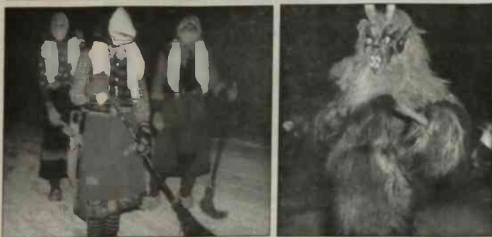
▲ Diabły-dziobące mogą być uciążliwe jak stado kruków... ◆ Aby wystraszyć diabła trzeba wyglądać straszliwie...