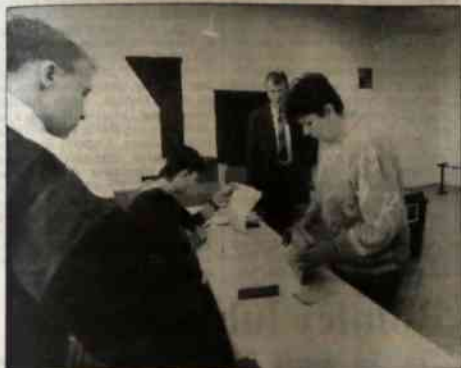
▲ W lokalu wyborczym mieszczącym się w gmachu Akademii Handlowej w Karwinie-Granicach.