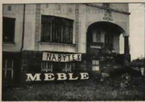
▲ Dwujęzyczność nie jest tylko tematem zaoziemiańskim. Coraz częściej staje się aktualna i po drugiej stronie Odrzy. Zdjęcie zostało wykonane na ulicy 3 Maja w Cieszyźnie.

Nie sągnowane materiały publicystyczne i informacyjne pochodzą z satelitarnej sieci informacyjnej Polskiej Agencji Prasowej lub z "Magazynu PAP".