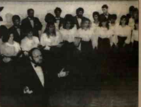
"Collegium Cantorum" w roku 1994.

NASZ ADRES: Redakcja "Głosu Ludu", P.O. Box 29, Novinářská 3, 709 29 OSTRAVA 1. UWAGA: Pisząc do nas nie zapomnij podać swego adresu i napisać, ile masz lat!