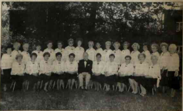
▲ Frysztaćka "Kalina".