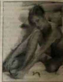
zmęczone, obolałe i pekaące, ulgę przyniesie im preparat odświeżający lub zasyпка, np. mytowa.

czający z naturalnymi składnikami trącajmy (aż to drobnik pestek brzoźkwin). Tam, gdzie zrogowacenia są szczególnie uporczywe, przed zastosowaniem kremu dobrze jest posłużyć się specjalnym płnikiem do usuwania stwardniałego nasaskórka.