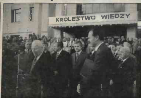
▲ Z uroczystości otwarcia polskiej szkoły w Grodnie na Białorusi (21 września br.). ◀ Szkołę wzniesiono kosztem ok. 2 mln dolarów USA.

Szkoła polska w Grodnie przewidziana jest na 540 uczniów. Ma 18 sal wykładowych, 3 gabinety specjalistyczne, salę gimnastyczną z si-