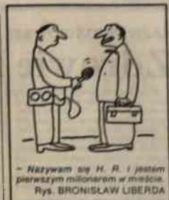
- Nazywam się H. R. i jestem pierwszym milionerem w mieście. Rys. BRONISŁAW LIBERA