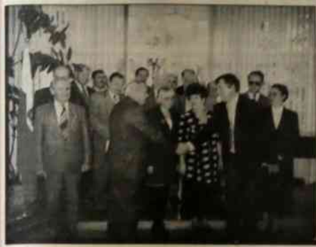
▲ Uczestnicy spotkania przedstawicieli polskiego biznesu w RC.