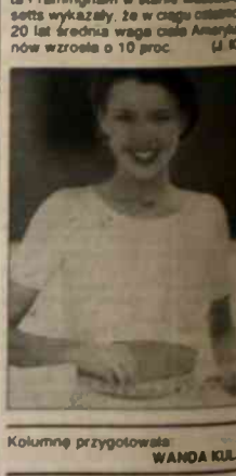
Kolumnę przygotowała WANDA KULA

Isłame zawarta w hadisach. 16. Bramka - został odkryty przez me-... (Continuation of the crossword puzzle clues).