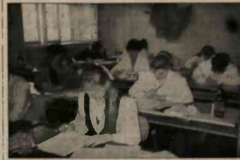
▲ Uczennice Chrześcijańskiej Szkoły Rodzinnej podczas egzaminów pisemnych.

oczywiście, żebym sam w sprawie z ichżal mogę jednak służyć radą, mogę powiedzieć, do kogo trzeba się zwrócić, by daną sprawę załatwić. Mogę też służyć radą starostom gmin, członkom przedstawicielstw gminnych, bo myślę, że mam w tym zakresie sporo doświadczeń". Ciąg dalszy na str. 2