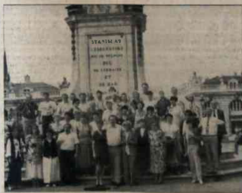
Sancti Joannis de Deo B-dur" J. Haydna.