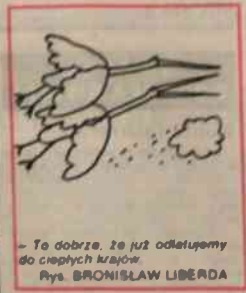
- To dobrze, że już odlatujemy do ciepłych krajów. Rys. BRONISŁAW LIBERDA