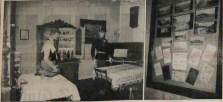
▲ Tych wszystkich, którzy w czasie weekendu zawiatają do Cieszyna, zachęcić można do zwiedzenia wystawy zastawionej w mieszczym muzeum.

Materiały nie sygnowane pochodzą z serwisu informacyjnego Polskiej Agencji Prasowej.