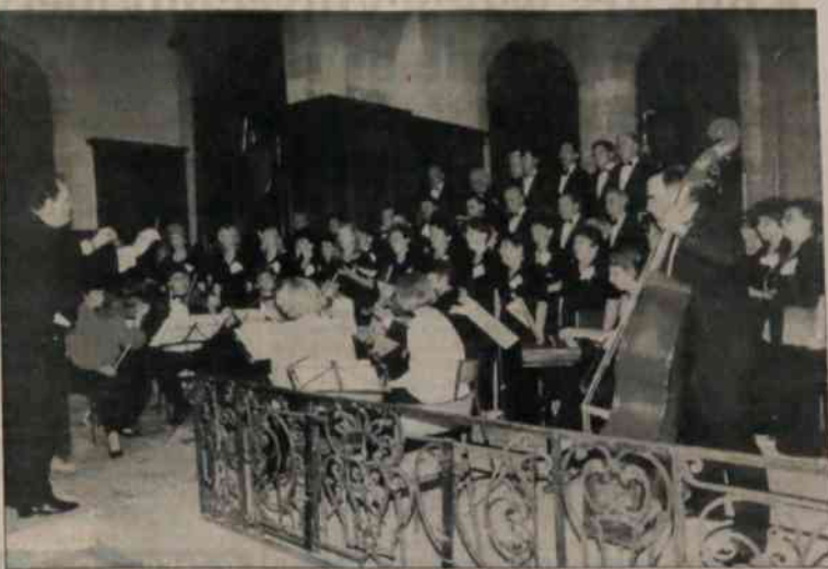
▲ Koncert w katedrze w Relanges.

Następny dzień, środa 21 sierpnia, przywitał trzynieckich amatorów pogodą w krainie oraz chmurami skrzętnie maskującymi urocy krajobraz nad jeziorem Vierwaldstattersee. Przedpołudnie przeznaczono było na zwiedzanie Lubiny, oglądanie na nowo zrekonstruowanego spalonego przed rokiem słynnego mostu Kapellbrücke, drobne zakupy itp. Pożnym popołudniem zespoły wyjechały już w strojach koncertowych do pobliskiej miejscowości Ebikon, gdzie o godz. 20 odbył się w kościele Santa Maria pierwszy zagraniczny koncert, który