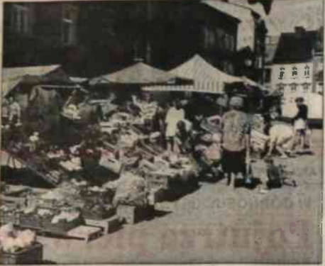
▲ Oferta owoców i jarzyn w Cieszyne na Starym Targu zedźwie bogactwem wyboru i przystępnością cen. Nic dziwnego, że do starych klientów cieszyńskich straganarzy należą też zagraniczni goście ze Olizy.

Międzynarodowy ośrodek uniwersytecki pod nazwą "Miasto wiedz" powstaje w Panamie, na terenach byłych baz wojskowych USA.