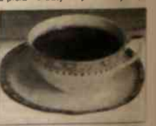
Kolumnę przygotowała WANDA KULA

Redakcja. Kolumnę przygotowała WANDA KULA