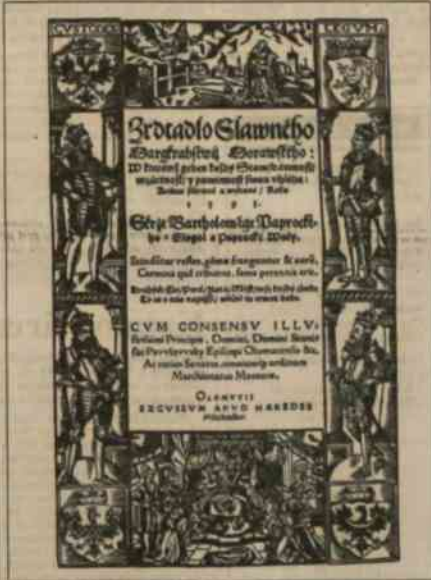
▲ Strona tytułowa starodruku 'Zwierciadło sławne margrabstwa morawskiego' Bartosza Paprockiego.