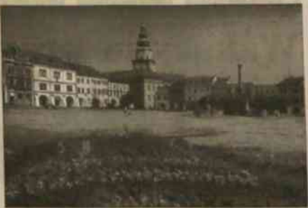
▲ Piętne odnawiany rynek w Kromierzyżu.