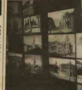
▲ Wśród artystów fotografii jedynym polskim aktorem w roli tytułowej "Domu Polskiego". Zebrało chociażby fotografię Polskiej Szkoły Wydziałowej w Morawskiej Ostrawie, czego nie można powiedzieć o uszczęplonych w ekspozycji Gminnym Muzeum.