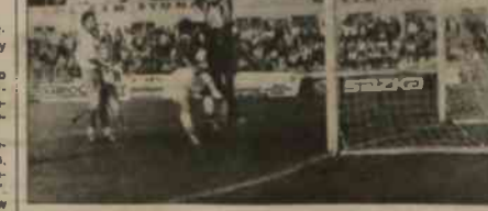
▲ Z meczu Karwinia - Trzinec rozegranego w ubiegłym sezonie (2:1).