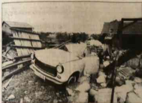
▲ Plac budowy koła domu państwa Włochy w Rychwałdzie bezpośrednio po wicherze ▶ Drzewa kiedy się pokotem...