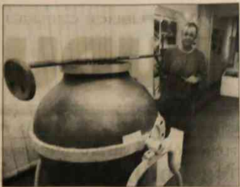
▲ Pиво stało się u nas napojem niejakiego narodowym. Także na Śląsku Cieszyńskim - nie tylko w Czechach - ma warzenie piwa bogate tradycje...

Ministerstwo rybołówstwa pochodzi z sektora reformacyjnego Polskiej Agencji Prasowej