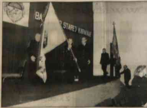
Ballada o starej Karwinie, mieście, którego nie ma... to nazwa imprezy, która odbyła się w ub. sobotę w czeskojęzycznym hotelu "Piast"...

Materiały nie sygnowane pochodzą z serwisu informacyjnego Polskiej Agencji Prasowej.