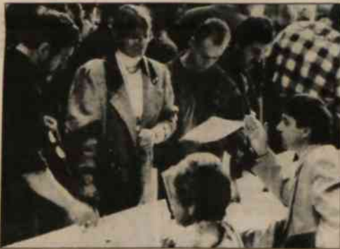
▲ Na ostrawskiej giełdzie pracy.