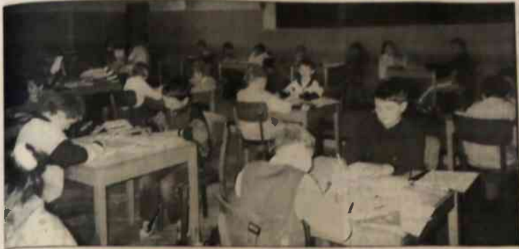
Zmagania konkursowe przebiegły w sali ośrodka w Cierlicku.