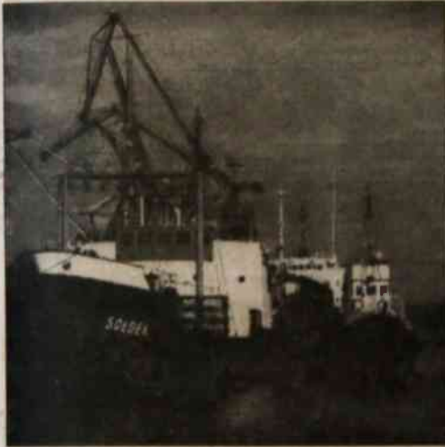
▲ Historyczny "Sodek".