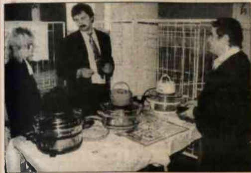
▲ W Domu Kultury w Ostrawie-Porubie od wczoraj otwarta jest wystawa lekarstw, sprzętu medycznego, artykułów spożywczych i literatury fachowej dla osób cierpiących na cukrzycę "Diabetyk". Na miejscu można zasięgnąć też porady lekarza-diabetologa. Wystawę zwiędzać można dziś do godz. 17.00.