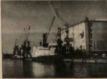
▲ W porcie szczecińskim. ◆ Biurowiec Polskiej Żeglugi Morskiej w Szczecinie (z prawej).

W styczniu 1997 roku Polska Żegluga Morska obchodzić będzie jubileusz 45-lecia swojej działalności