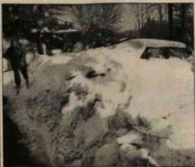
▲ Słoneczna pogoda w dniach ostatniego weekendu zwabiła w Beskidy liczne rzesze amatorów białego szaleństwa. Z pewnością nikt nie pożałował, warunki śniegowe były wprost idealne, tak na narciarskich, jak i trasach biegowych, chociażby tej prowadzącej na Biały Krzyż (na zdjęciu). Nieco kłopotów mogli mieć tylko zmotoryzowani.