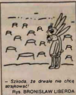
- Szkoda, że drwale nie chcą strąkować! Rys. BRONISŁAW LIBERDA