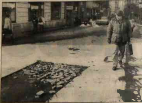
Śurowa i długa zima narusza nawierzchnie dróg. Dziury na drogach zauważyć można w tych dniach także w samym centrum Ostrawy.

Materiały nie sygnowane pochodzą z serwisu informacyjnego Polskiej Agencji Prasowej.