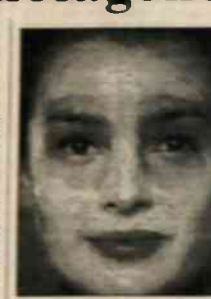
winy stosować pod nią podkład z

Jest to rybnikanka z naturalnych włókien kolagenowych pochodzenia zwierzęcego..."