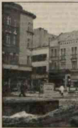
▲ Odnawiane elewacje kamieniczek dodają Ostrawie blasku. Zdjęcie zrobiono na tzw. "Kurzym rynku".

"Jeśli ludzie chcą się poznać, spotykać, to obowiązkowo tych dwóch ratuszów jest im to umożli-