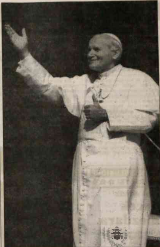
JAN PAWEŁ II CZYTA W KAŻDEJ WOLNEJ CHWILI...