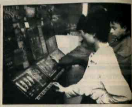
▲ Dla widzów znowu na zdjęciu młodych ludzi problem wrodzonego "niechęci" jest. Wykrył opóźniał bowiem także wolną chwilę w towarzyszenie... automatów do gry hazardowej, Niektórzy z nich stracą "tyko" pieniądze, inni - także zdrowie, popełnią w czasie uzależnienia psychicznego od "jedynorobich bandytów" Wbrow coraz powszechniejszemu przekonaniu o szkodliwości tego rodzaju rozrywki, liczbę automatów do gry rośnie.

automatów do gry hazardowej, Niektórzy z nich stracą "tyko" pieniądze, inni - także zdrowie, popełnią w czasie uzależnienia psychicznego od "jedynorobich bandytów" Wbrow coraz powszechniejszemu przekonaniu o szkodliwości tego rodzaju rozrywki, liczbę automatów do gry rośnie.