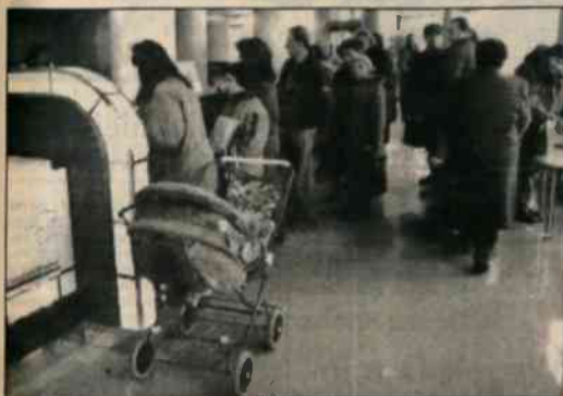
▲ Długie kolejki nie są w tych dniach w ostrawskim urzędzie zabezpieczenia społecznego rzadkością. Aby zrealizować formalności związane z przyznaniem zasiłków na dziecko lub dotacji na pokrycie kosztów dojazdu dzieci do szkół czy na uczelnie, trzeba stać nawet parę godzin...