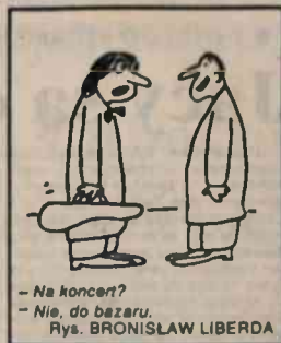
- Na koncert? - Nie, do basaru. Rys. BRONISŁAW LIBERDA