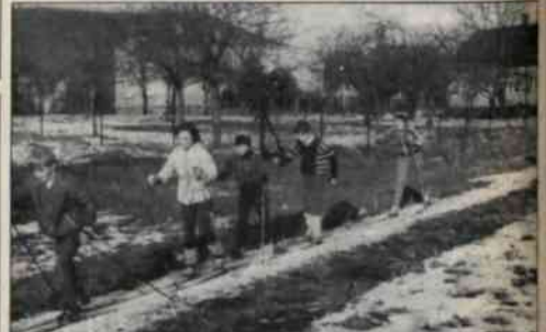
W ostatnich latach zimy coraz rzadziej nawiązuje do Podbeskidzia. W takich oto warunkach przychodzi naszym młodzieńcom na Łazcy Górnicy. Przy tym nie ma wiadomości, czy ten jubileuszowy XXV ZG w ogóle się odbędzie. Zapisz o tym na nr. 112 czwartego numeru.

W 3. TYGODNIU SĄDKI pod nr. 8 zamiat 1 (jak mylnie podał CTK) powiatowy byc. D. Nowy podzielił nagród: 1- 63 781 Kč (2) - 10 107 Kč (69), 11 - 136 Kč (688).