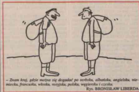
Znam kraj, gdzie można się dogadać po serbsku, albańsku, angielsku, niemiecku, francusku, włosku, rosyjsku, polsku, węgiersku i czesku.