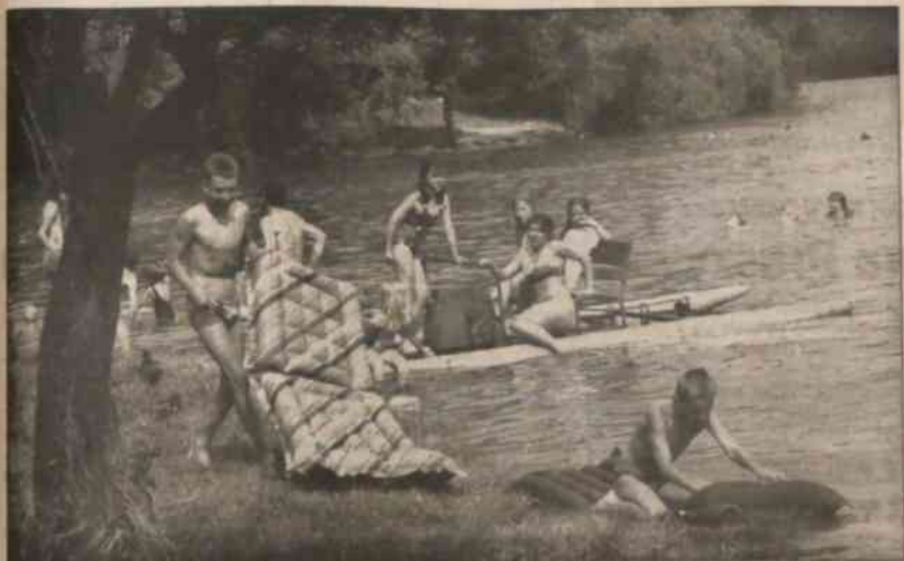
▲ W połny dzień nad Zalewem Cierlickim.