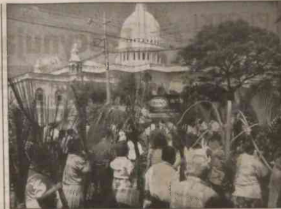
▲ Niedziela palmowa w San José. Procesja przed kościołem parafialnym wybudowanym w stylu bazyliki św. Piotra w Rzymie.