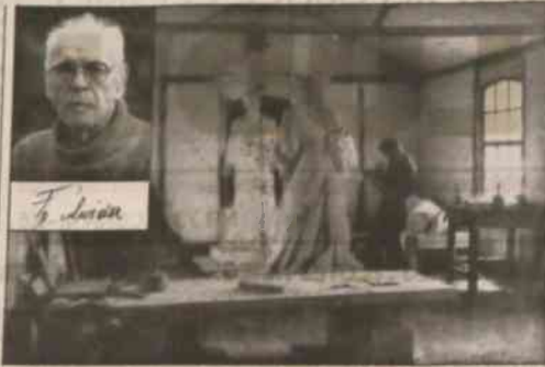
Artysta pracuje nad grupą „Żywocickiej wsi” - Jeden z ostatnich portretów z zbiorów (6)

Nie egzynowane materiały publicystyczne i informacyjne pochodzący z satelitarnej sieci informacyjnej Polskiej Agencji Prasowej.