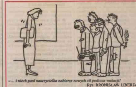
i niech pani nauczycielka nabierze nowych sił podczas wakacji!