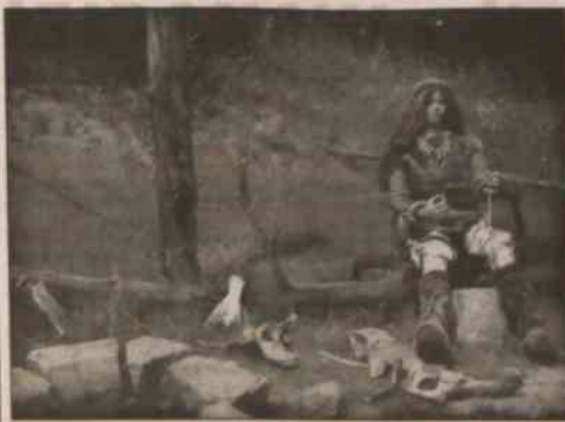
◆ Łowcy mamutów pilnują swego domostwa.

Na „poszukiwacza przygód”, który zdecyduje się po prostu wejść na Landek, aby na własnej skórze poczuć oddech pradawnej historii, czeka raczej rozczarowanie. Owszem, wędrować