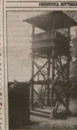
▲ Wielka widokowa na wzgórze Landek. Pod nią, być może, spoczywają po dziś dzień kości mamutów i naręczki przapradków.